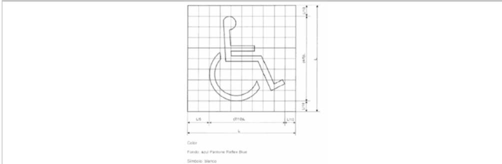
GRAFICO DEL "SIA"